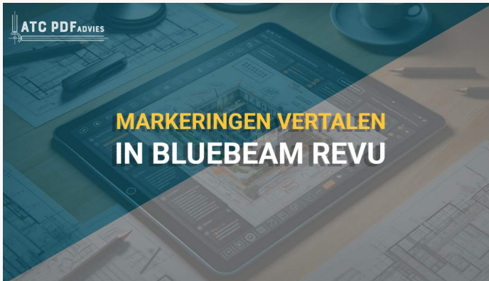
Hoe U Markeringen Kunt Vertalen in Bluebeam Revu 21