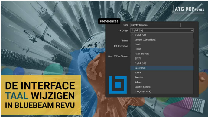
Hoe de Interface-taal te Wijzigen in Bluebeam Revu 21