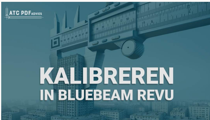
Hoe kunt u de schaal van een tekening kalibreren in Revu

Klik op de knop hieronder om onze Bluebeam Trainingen voor Beginners en Gevorderden te verkennen.